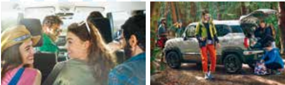
*ナビゲーションは販売会社装着アクセサリです。