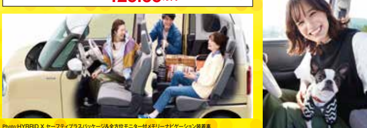
Photo:HYBRID X セーフティプラスパッケージ&全方位モニター付メモリーナビゲーション装着車

ワゴンRスマイル G 2WD・CVT車 129.69万円からご用意しております。