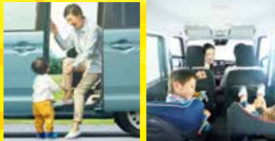
※写真中のジュニアシート、チャイルドシートは、販売会社装着アクセサリ(別売)です。

▲〈デュアルセンサーブレーキサポート・デュアルカメラブレーキサポート・後退時ブレーキサポート・誤発進抑制機能・後方誤発進抑制機能・アダプティブクルーズコントロール[全車速追従機能付]について〉■検知性能・制御性能には限界があります。これらの機能に頼った運転はせず、常に安全運転を心がけてください。■状況によっては正常に作動しない場合があります。■対象物、天候状況、道路状況などの条件によっては、衝突を回避または被害を軽減できない場合があります。■ハンドル操作やアクセル操作による回避行動を行なっているときは、作動しない場合があります。■詳しくは販売会社にお問い合わせください。