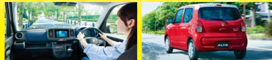
Photo:HYBRID X 全方位モニター付ディスプレイオーディオ装着車 ※全方位モニター付ディスプレイオーディオ装着車はHYBRID Xのグレードのみの設定で112,200円高