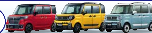
スペーシア カスタム スペーシア ギア スペーシア ギア マイスタイル